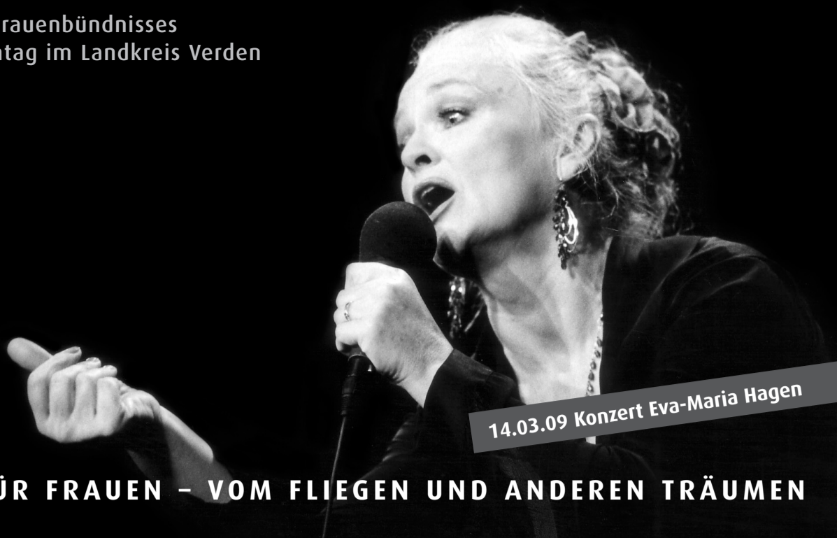
14.03.09 Konzert Eva-Maria Hagen